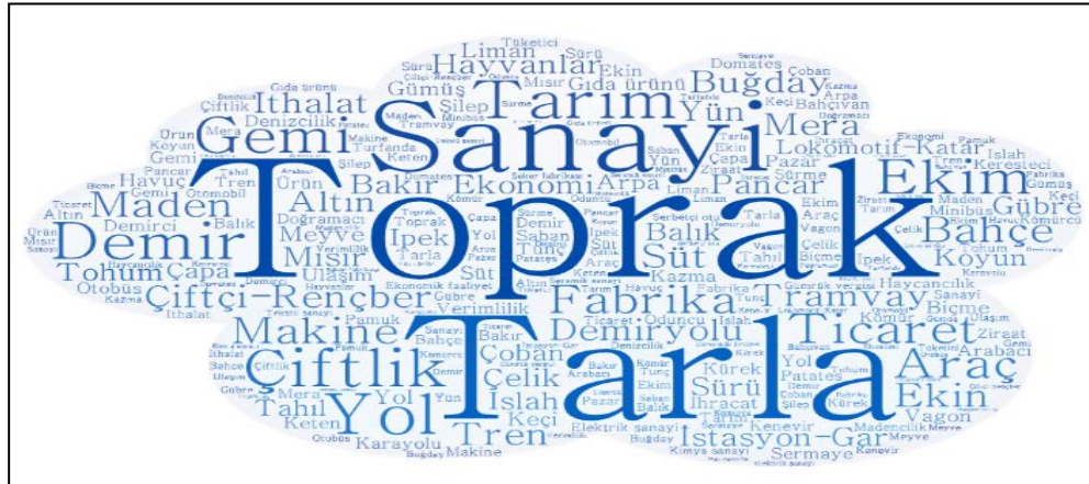
Şekil 3. Beşeri Coğrafya Alt Dallarna Göre Kullanılan Coğrafi Kavramların Kelime Bulutu.

Cenap Şahabettin'in "Avrupa Mektupları" eserinde Ekonomik coğrafyanın alt dallarından olan tarım ve Sanayi coğrafyası alt dallarına ait kavramlarının diğerlerinden daha fazla kullanıldığı görülmüştür. Tablo 8'de sıralanan kavramlardan; Toprak (72), tarla (47), sanayi (41), çiftlik (37), tarım (35), çiftçi (rençber) (33) ve fabrika (32) kavramlarının ilk yedi sırada olduğu tespit edilmiştir. Diğer kavramların ise 10'lu rakamlar ve altında sıklıklar ile kullanıldığı görülmektedir. Tarımda üretilen ürünler ve sanayi dallarına ait kavramların çokça kullanıldığı dikkati çekmektedir. Eserde geçen bu ekonomik coğrafya kavramlarına ait faaliyetlerin günümüzde de hala kullanıldığı ve yapıldığı görülmektedir.