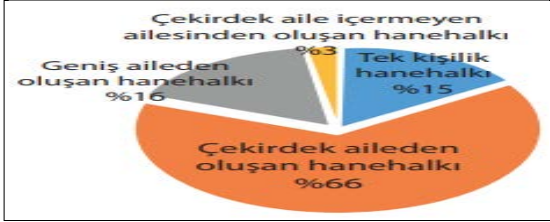
Grafik1. Türkiye’de Aile Yapısı