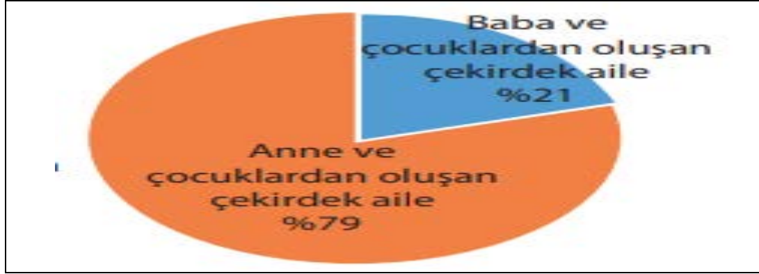
Grafik 3. Türkiye’de Çekirdek Ailede Ebeveyn Durumu