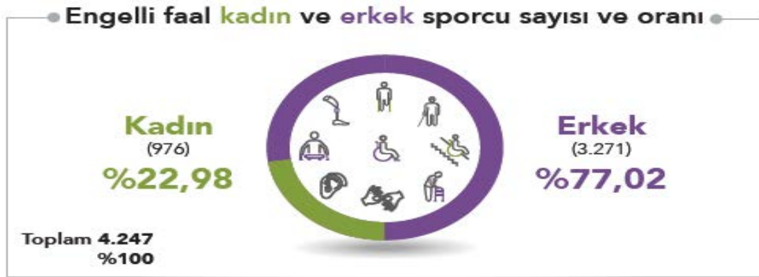
Şekil 2. 2021 Yılı 4 Spor Federasyonuna (Bedensel Engelliler, Görme Engelliler, İşitme Engelliler ve Özel Sporcular) Bağlı Engelli Faal Sporcular

1900'lerin başına dek uzanan engelli sporu tarihi de tıpkı sporun tarihinde olduğu gibi erkek sporcuların deneyimleri ve bakış açısıyla başlamaktadır (DePauw, 1999: 50). Engelli kadınlar engelli erkeklere göre kamusal hayatta daha az görünür olmalarının bir sonucu olarak sporun içinde de yer alma konusunda geri planda kalmaktadır. Engelli kadınların spordaki deneyimlerini anlamak aynı zamanda toplumdaki engelliliğe, engelli sporculara, engelli kadının toplumsal konumuna ilişkin çok boyutlu bir bakış açısı gerektirmektedir. Dewar (1993: 213) sporda kadınların ikincilliğini anlamaya çalışırken tüm kadınların "dışlanmışlık" deneyimlerinin aynı olduğunu var sayan açıklamaların problematik olduğunu belirtmektedir. Sporda "beyaz, orta sınıf, sağlam, genç, heteroseksüel" kadınların deneyimlerini evrenselleştirmek ve tüm kadınların spordaki dışlanmışlık deneyimlerini anlamaktan uzaktır. Bu açıdan farklı kadın deneyimlerini içeren yeni açıklamalara ihtiyaç duyulmaktadır.