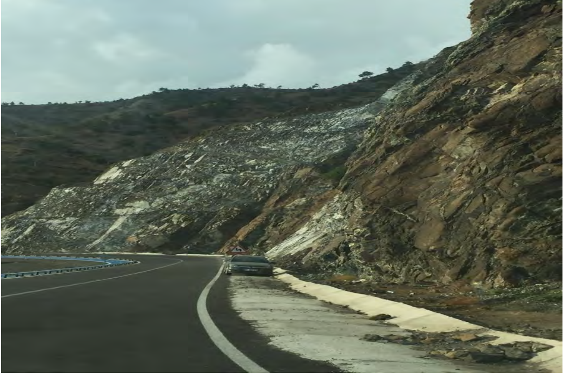
Resim 3. Samandağ-Arsuz Karayolu ve Bisiklet Yolu