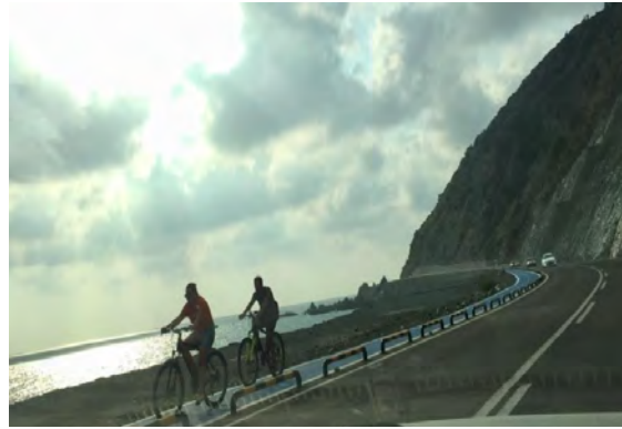
Resim 2. Bisiklet Yolu