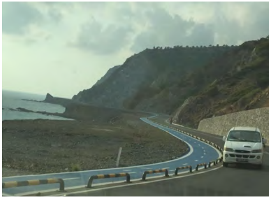
Resim 1. Bisiklet Yolu

Araştırma yapılan bölgede (bisiklet yolu ile yolun birbirine bağladığı destinasyonlar) bisiklet turizminin gelişiminin yanı sıra farklı turizm türlerini görebilmek mümkündür. Bölgede kıyı turizmi, doğa ve spor turizmi, gastronomi turizmi, kültür turizmi, kamp/karavan turizmi, sualtı dalış turizmi, kuş gözlemciliği, sportif olta balıkçılığı faaliyetleri de yapılabilmektedir. Diğer bir ifade ile bölgeye bisiklet amaçlı gelen ziyaretçiler diğer turizm faaliyetlerine de katılabilmektedir.