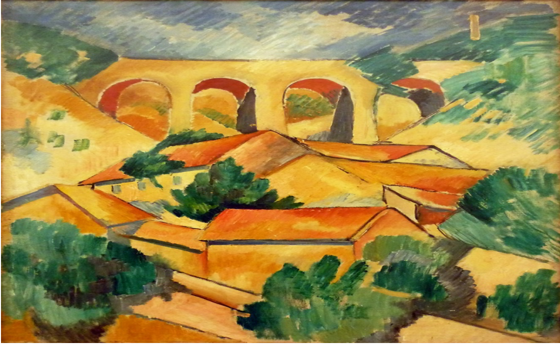
Şekil 5. Georges Braque, " L'estaque'de Viyadük", 1908.