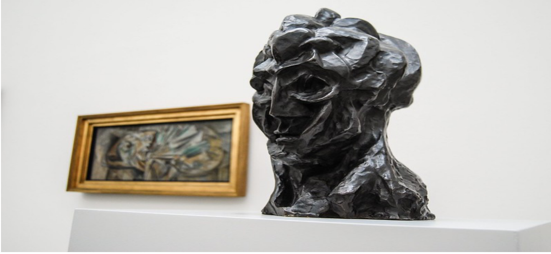
Şekil 7. Pablo Picasso, Bir Kadının Başı, 1909-10.