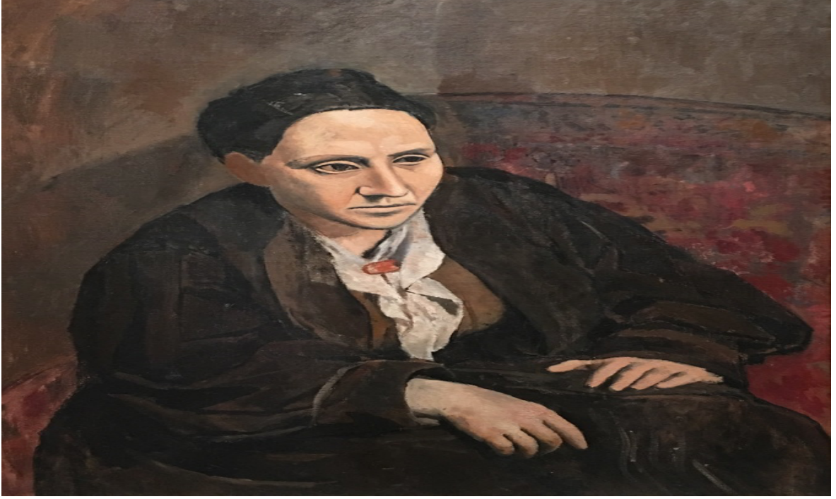
Şekil 3. Pablo Picasso, "Gertrude Stein," 1905-1906.