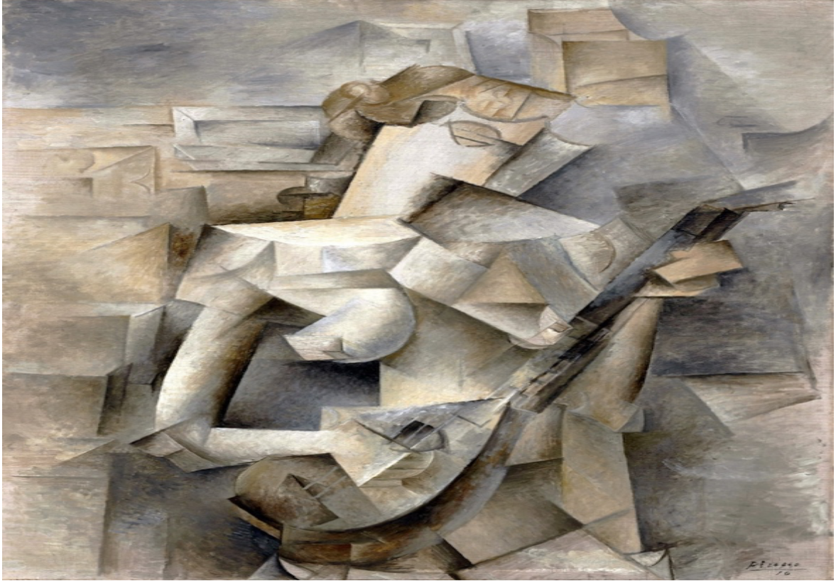
Şekil 1. Pablo Picasso, "Mandolinli kız", 1910.

Kübist eserlerde nesnelere parçalanır, analiz edilir ve soyut bir biçimde yeniden birleştirilir (Şekil 1). Nesnelere tek bir bakış açısından çizmek yerine, sanatçı konuyu daha geniş bir bağlamda temsil etmek için konuyu çok sayıda bakış açısıyla tasvir eder. Genellikle yüzeyler görünüşte rastgele açılarda kesilerek tutarlı bir derinlik hissini ortadan kaldırır. Arka plan ve nesne düzlemleri, sığ belirsiz alanı yaratmak için iç içe geçer. Yazarların bilgisine göre, kübizm stilini modelleme ve otomatik olarak üretme girişimi olmamıştır. Stili ve yapım sürecini anlamada kavramsal zorluklar ve hem doku hem de çoklu bakış açıları modellemede teknik zorluklar vardır.