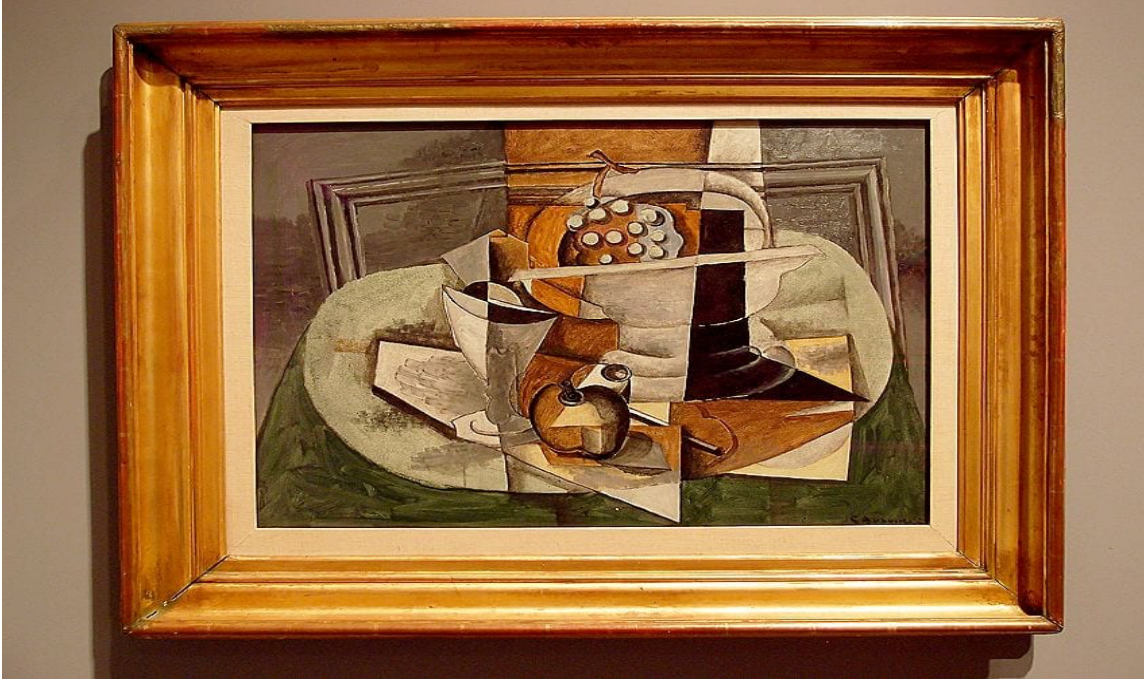
Şekil 11. Le Tapis Vert (1929) by Georges Braque.