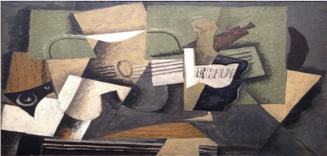
Şekil 8. Georges Braque, "ROM ve Gitar", 1918.

Sentetik Kübizm, 1912'de ortaya çıkan ve 1914'e kadar süren hareketin ikinci aşamasıdır. Bu süreçte Picasso, Braque, Gris ve diğer sanatçılar kompozisyonlarını basitleştirdi ve renk paletlerini aydınlattı. Sentetik Kübizm, resim veya kolaj sanatı olarak işlenen natüromort tasvirlerine ilgi gösterir (Sgourev, 2013). Sentetik Kübizm, Kübist hareketin daha sonraki bir gelişmesidir ve bu tarzın ilk resim temsilcisinin Pablo Picasso'nun 1912'deki 'Sandalye Sopasıyla natüromort' olduğu düşünülmektedir. Sentetik Kübizmin temel özellikleri, karışık medya ve kolajın kullanılması ve analitik kübizmden daha düz bir alanın yaratılmasıdır. Diğer özellikler, daha fazla renk kullanımı ve dekoratif efektlere daha fazla ilgi göstermektir. Sentetik Kübizmin gelişiminde Picasso, Güzel Sanatlar resminde kolaj ve metin kullanan ilk kişiydi. Kübist resimler arasında gazetelerden, notalardan, kumaş parçalarından ve boyalı metinlerden kesimler vardı. Sentetik Kübizm, nesnelere analiz için ayırmak yerine bir araya getirme eğilimindeydi. Kullanılan cihazların çoğu, resim düzlemini düzleştirmek ve önceki analitik Kübist resimlerden daha az derinliğe sahip bir görüntü oluşturmak için tasarlanmıştır.