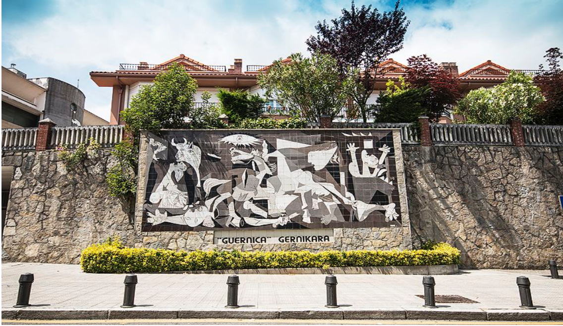
Şekil 10. Pablo Picasso'nun Guernica'sı İspanya'da Sergileniyor.

"Mandolinli kız (Şekil 1)" (1910), Picasso'nun gerçekliğin çarpıklıklarının etkileyici bir etki için nasıl kullanıldığının daha da çarpıcı bir örneğidir. Resmin büyüğü ve çekiciliği tam olarak ışığın tonlarından ve vücudun formunun basitleştirilmiş karesinden gelir. Resmi siyah beyaz yakınlarındaki yakınlarındaki tüm tonları kullanılabilecek üzerinden gerçek olamayacak kadar kahverengi tüm çünkü. Ve bu tonların birleşimi, resmin olağanüstü atmosferini yaratıyor, ki bu arada, Mavi Döneminkinden çok daha az teatral. Bu büyülü atmosfer, kızın tıngırdayan elinde, mafsalların olacağı çizgi boyunca uzanan saf ışık çizgisinde doruğa ulaşır. Elin inceliği, özellikle bilekte, formunun sadeliği ile vurgulanır. Giorgione 'nin "konser Şampanyası" ndaki tıngırdayan eli çok andırıyor." Oyuncunun sağ göğsü de kahverenginin açık ve koyu tonları arasındaki keskin kontrastın yanı sıra gerçekçi olmayan cömert eğriden de şehvet kazanıyor. "Mandolinli kız" gibi bir resmin tarzının bu kadar narin ve güzel olmasının nedeni, kızlar ve müzikle ilgili olmasıdır. Bu, insani değer açısından anladığımız bir şeyle ilgili. Stil, bu değeri ifade etmekten başka bir şey yapmaz. Ve böylece, kız ve müzik kaybolduğunda, stilin şiirini kaybedeceğimizden ve koyu kahverengi geometri ile bırakılacağımızdan eminizdir.