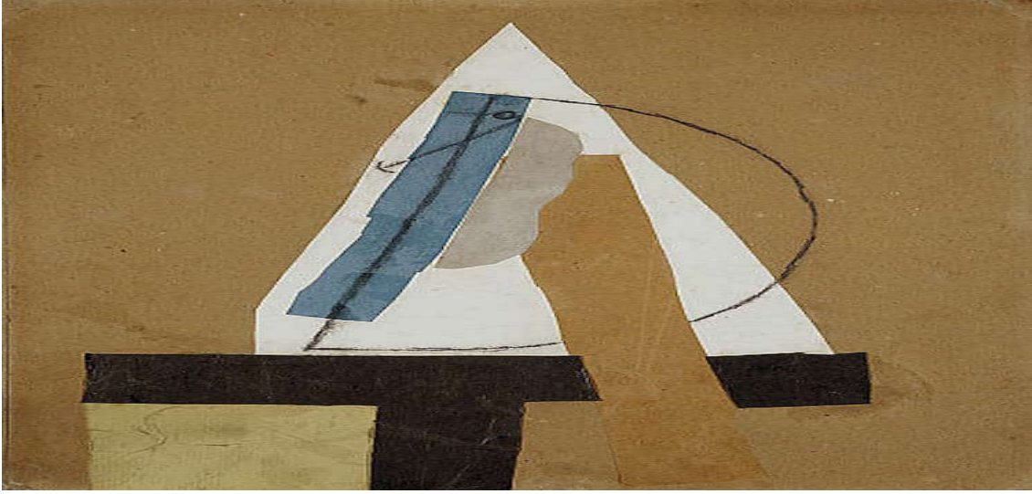
Şekil 9. Pablo Picasso, "kafa", 1913-1914.