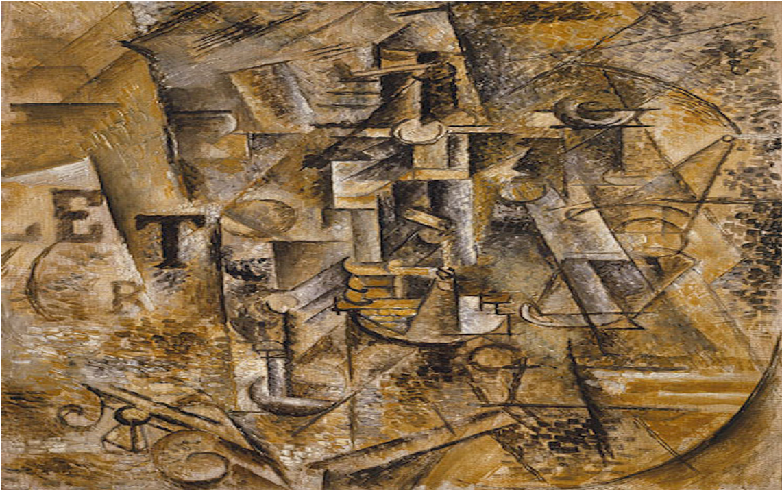
Şekil 6: Pablo Picasso, " Bir Şişe ROM ile Natürmort", 1911 (Metropolitan Sanat Müzesi).

Hareketin ilk resmi aşaması analitik Kübizm olarak bilinir. Bu dönem 1908'den 1912'ye kadar sürdü ve nötr tonlarda işlenen parçalanmış nesnelerin kaotik resimleriyle karakterize edildi (Sgourev, 2013). Picasso, analitik Kübizm ilkelerini heykel pratiğine de uyguladı ve fazın perspektife deneysel yaklaşımını vurgulayan bir dizi büst ve figürle sonuçlanmıştır.