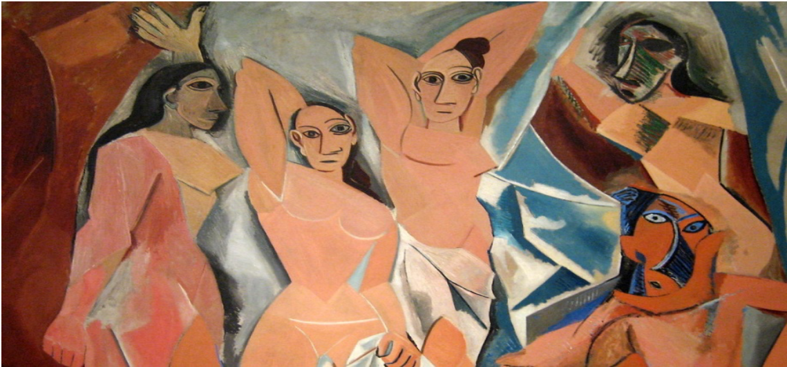
Şekil 4. Pablo Picasso, "Les Femmes d'Alger (O.J.)," 1907.

Les Demoiselles d'avignon, belki de Picasso'nun Afrika döneminden kalma en ünlü eseridir. 1907 tarihli, figürlerin maske benzeri yüzlerinde ve parçalanmış öznesinde açıkça görüldüğü gibi, Primitivizm ve Kübizmin zirvesinde yaratılmıştır.