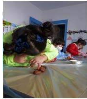
Görsel 2. Öğrenciler Seramik Sanatı Nesnelerini Elle Şekillendirme Tekniği Uygularken Kaynak: (Etik İzinli -Yazar Arşivi).