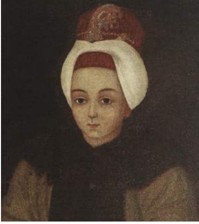
Şekil 23. Şehzade III. Selim Yüz Ayrıntısı TSMK 17/117, Rafael, 1773 (Renda, 2000: 464).