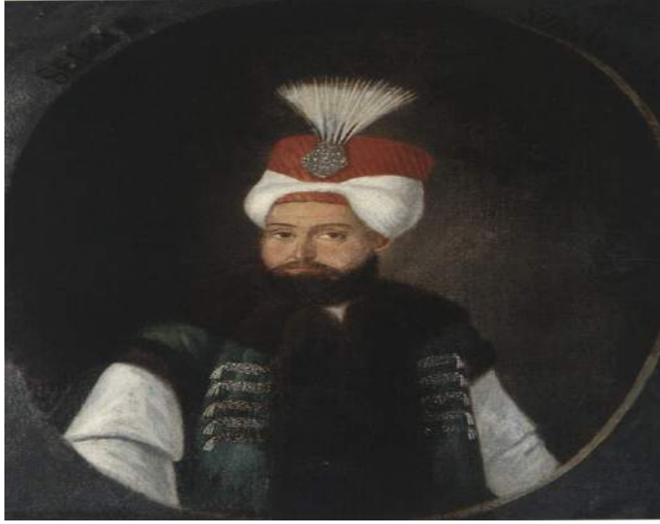
Şekil 11. Sultan III. Selim Büst Portresi, Jean-François Duchateau, 1792, TSMK. 17/32