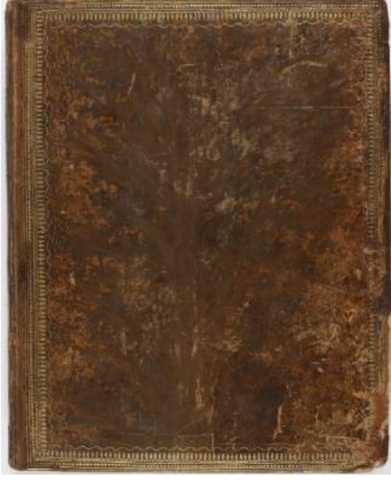
Şekil 1. Kitap Cildi, Ön Kapak

açıklamaya yer verilmiştir.: “69. Dessein Originaux de Costumes Turcs 1796 ”; Türkçesi “ Türk Kıyafetlerinin Orijinal Çizimi 1796 ”dır. Bu tarih bize albümün yapıldığı tarihi göstermektedir.