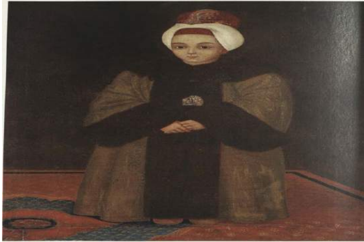
Şekil 6. Şehzade III. Selim, TSMK 17/117, Rafael, 1773

(Küçükhasköylü, 2011: 167) veya Manasi olarak geçmektedir ve aynı zamanda mimar ve müzisyen olan Rafael'in, Sultan I. Mahmud (s. 1730-1754), Sultan III. Osman (s. 1754-1757), Sultan III. Mustafa (s. 1757-1774) ve Sultan I. Abdülhamid'in (s. 1774-1789) portrelerini yaptığı belirtilir (Mahir, 2005: 170-171). Rafael, Levni'nin resimlediği Kebir Musavver Silsilename'ye son dört padişahın portrelerini de eklemiş ve bunlarda yeni bir kalıp geliştirmiştir. Zeminde tek rengi tercih etmiş, figürlerin ön plana çıkmasını amaçlamış, onları tahta otururken ve cepheden göstermiştir. Bu üslup bundan sonra da birçok padişah portresinde uygulanmıştır (Bağcı vd., 2006: 281; İrepoğlu, 2000: 388).