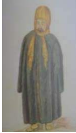
Şekil 27. Sultan I. Abdülhamid Tebdil-i Kıyafetle, no.45, Pichelstein Albümü 1779-1789 (Küçükhasköylü, 2010: 215).