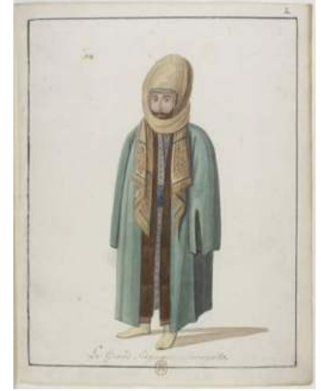
Şekil 28. Sultan III. Selim Tebdil-i Kıyafet İçinde, BNF, Od.23, no.2.