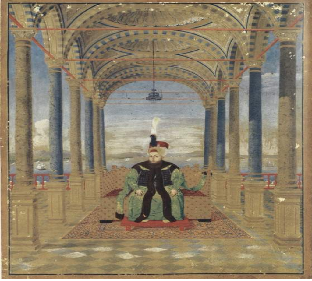
Şekil 17. Sultan III. Selim, Kostantin Kapıdağlı'ya Atfedilmektedir Kaynak: (Renda, 2000: 447).