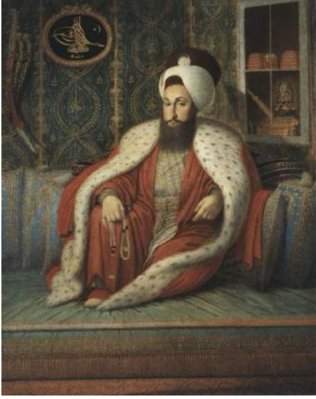
Şekil 13. Sultan III. Selim Odasında, Kostantin Kapıdağlı, 1803 TSMK, 17/30 Kaynak: (Renda, 2000: 467).