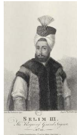
Şekil 22. Selim III. BNF, Cabinet des Estampes, N20006 (Renda, 2000: 499).

BNF. Od. 23 numaralı albümde Sultanı tebdil kıyafet içinde gösteren portreyle karşılaştırmak için, Diez Albümü (Şekil 26) ve Pichelstein Albümü'ne bakılabilir (Şekil 27). Bu albümlerde bulunan Sultan I. Abdülhamd'in tebdil-i kıyafet tasvirleri III. Selim'in tebdil-i kıyafet resimlerine oldukça benzemektedir. Her iki albümde arka plan beyazdır ve kıyafetleri koyu yeşil, başlığı ve ayakkabıları sarı olan Diez Albümü'ndeki örnek, yüzünün yarısını başlığındaki örtüyle kapatılmış olması açısından Od.23'te bulunan örneğe (Şekil 28) daha çok benzemektedir.