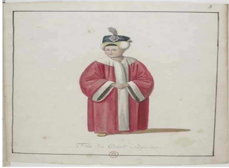
Şekil 5. Sultan III. Selim'in Şehzadelik Tasviri, BNF, Od.23, No.3.

Albümdeki son Sultan III. Selim tasviri ise, no.3'te bulunmaktadır. Sultanın erkek çocuğu olmamasından dolayı tasvirin padişahın şehzadelik yıllarına ait bir portresi olduğu anlaşılmaktadır. Resmin altında "Padişahın kızı" anlamında gelen "Fille du Grand Seigneur" yazısına yer verilmiştir. Dolayısıyla tasvir için yanlış bir açıklama yazılmıştır. Portrede III. Selim boydan ve 3/4 oranında cepheden resmedilmiştir. Elleri ortada kavuşturulmuş olarak çizilen tasvirde yüz biçimi, kaş ve göz şekilleri yetişkinlik tasvirlerine benzer şekilde yapılmıştır. Başlığı, koyu yeşil üzerine siyah çizgilerle ve ucunda beş adet tüyden oluşan sorguçla sonlandırılmıştır. Başlığın alt kısmı, kulaklarını kapsayacak biçimde enseden altına kadar dolanıp önden büzülen, beyaz ve sarı renklerden oluşan bir kumaşla çevrelenmiştir. Şehzadenin kaftanı kırmızı renk olup, boyun kısmından iki kanadın bittiği yerler ve kol uçları beyazdır. İçindeki kıyafet, boynundan ve sağ kol ucundan görünen küçük bir kısımdan anlaşılacağı üzere sarı renk üzeri kırmızı noktalarla meydana gelmiştir. Ayak bileklerine kadar uzanan kaftanın bittiği yerde, şehzadenin sarı ayakkabılarının uç kısımları görünmektedir (Şekil 5).