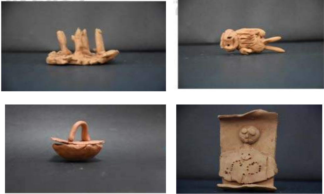
Görsel 3. Öğrencilerin Seramik Sanatı Eserlerinin Sergilenmesi