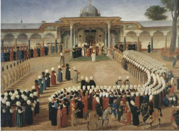
Şekil 7. Sultan III. Selim'in Kabulü, TSMK17/163, Kostantin Kapıdağlı, 1789 Kaynak: (Renda, 2000: 470)

olmakla beraber ince ve uzun bıyıklıdır. Beyaz rengindeki kavuğunun tepesinde değerli taşlardan oluşan sorgucu ve onun da tepesinden kırmızı renkle başlayıp sarı ile devam edip yukarı doğru uzayan tüylerle sonlandırılmıştır. Sultanın kaftanı, kırmızı renkte olup ayak bitimine kadar devam etmektedir. Boyun ve kaftan kanadının uçlarında, kolundan aşağı doğru sarkan parçanın ucunda siyak kürk bulunur, aynı kürk üst kol kısmında da çevrilidir (Şekil 8).