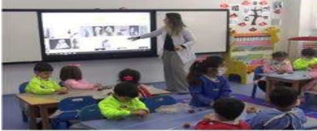
Görsel 1. Akıllı Tahtadan Seramik Eğitiminde Kullanılan Araç ve Gereçlerin Anlatımı

Biçimlendirme, insanın bilgisi, emeği ve tekniği ile düzen, ağırlık ve hacim kazandıran yapay varlıklar üretmesi olarak tanımlanabilir. Biçimlendirme iki temel noktada toplanır: Birincisi, mevcut olanı yansıtmaya, tekrarlama ve sürdürmedir; ikincisi ise yeni, değişik, ileri ve bilinmedik görünümler üretmektir (Daşdağ, 2009:71). Seramik eğitiminde kullanılan teknikler, öğrencilere seramik sanatının temel prensiplerini öğretmek ve onları çeşitli seramik üretim süreçlerinde yetkin hale getirmek için tasarlanmıştır. Atölye ortamında bulunamayan araç ve gereçler görsel öğeler ile öğrenciye aktarılmalıdır.