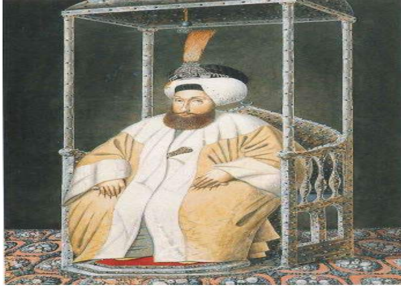
Şekil 15. Ressamı Belirsiz, 19. yy. Baş (Pera Müzesi, 2005: 29)

kaftanı sarı renktedir ve boyun ve kol bitim yerleri beyaz renkle bütünlenmiştir. Elleri dizlerinin üzerinde olan sultanın iki serçe parmağında da yuvarlak ve iri yüzük taktığı görülmektedir. Ucu taşlarla kaplı olan kılıcı göğüs hizasından dışarı doğru çıkmış, iç kaftanının mavi renkte olduğu, sakallarının bittiği noktada belirtilmiştir (Şekil 15).