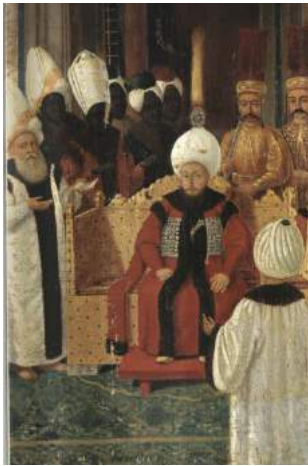
Şekil 20. Sultan III. Selim'in Kabulü, TSMK17/163, Kostantin Kapıdağlı, 1789 (Renda, 2000: 470).