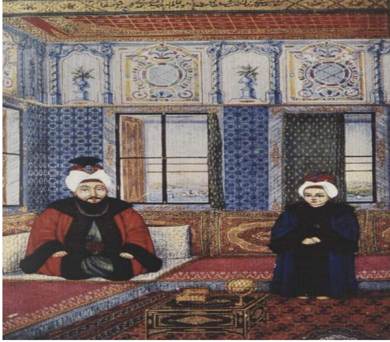
Şekil 10. Sultan III. Mustafa ve oğlu şehzade III. Selim, Rafael, İ.Ü, nr.9366 Kaynak: (Mahir, 2005: 248)