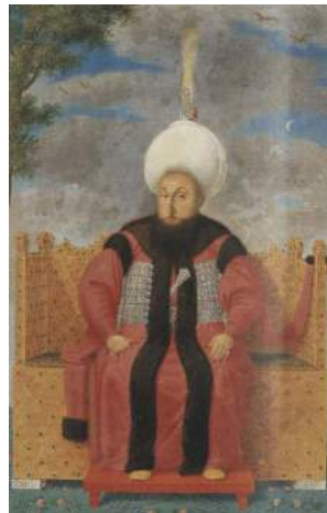
Şekil 21. Sultan III. Selim Bayram Tahtında, Kostantin Kapıdağlı'ya atfedilmektedir, 1789, TSMK A. 3109 (Renda, 2000: 472).