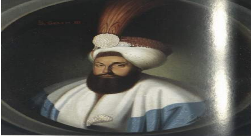
Şekil 16. Sultan III. Selim'in Büst Portresi, Andrea Appiani, 1807, TSMK. 17/960

Bu yazının Fransızca olmasından ve resmi belgeleyen uzmanların Fransız olmasından dolayı tablonun Topkapı Sarayı Kütüphanesi'ne gelmeden önce Fransa'da olduğu düşünülmektedir.