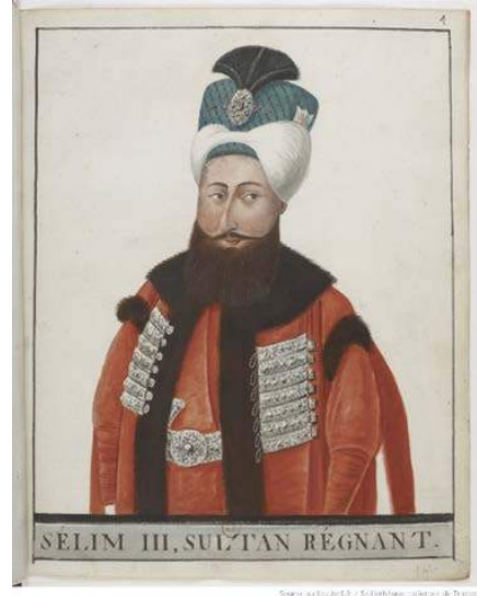
Şekil 19. Sultan III. Selim, BNF, OD.23, no.1.