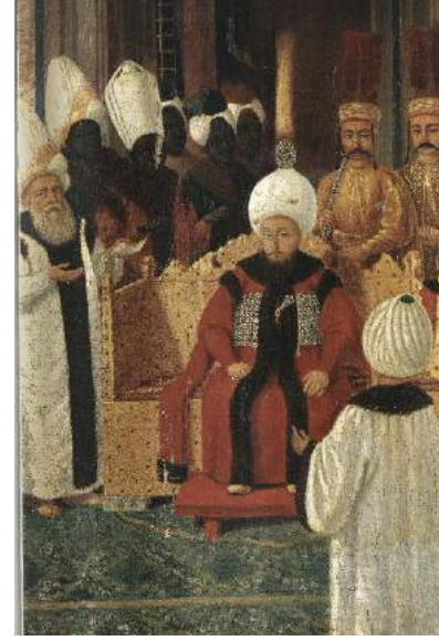
Şekil 8. Sultan III. Selim'in Kabulü, TSMK17/163, Kostantin Kapıdağlı, 1789