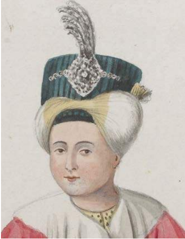
Şekil 25. Sultan III. Selim'in Şehzadeliği, Yüz Ayrıntısı BNF, Od.23, No.3.