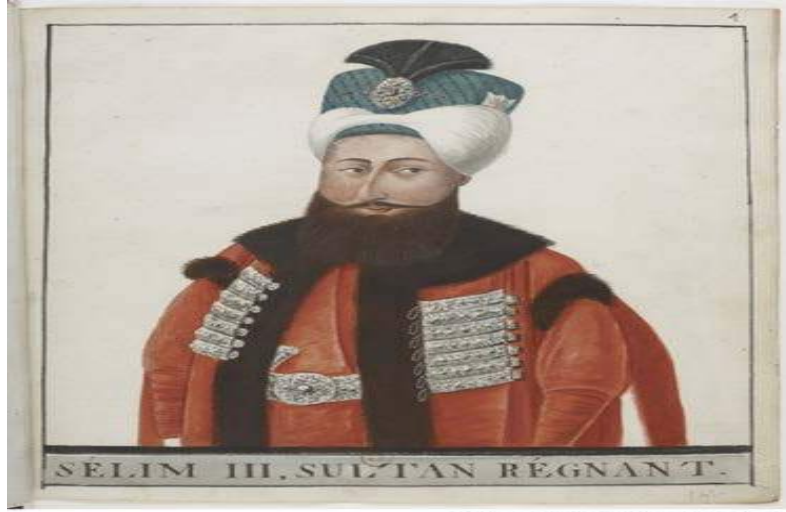
Şekil 3. Sultan III. Selim, BNF, OD.23, no.1.