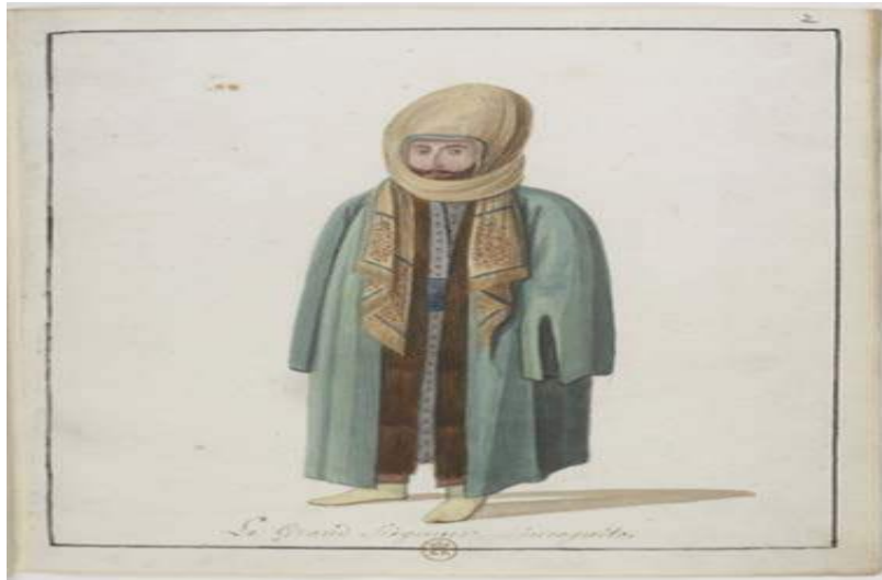
Şekil 4. Sultan III. Selim Tebdil Kıyafet İçinde, BNF, Od.23, no.2.

Sultan, burada oldukça hareketsiz ve durağan biçimde boydan resmedilmiştir. Uzun olan başlığı örtüsünün altındadır, başındaki kumaş yüzünün dörtte birinin kapatmış ve uçları sağ ve soldan aşağı doğru uzanmıştır. Dış kıyafetinin rengi yeşil olan sultanın iç giysisinin renginin de aynı olduğu görülmektedir (Şekil 4).