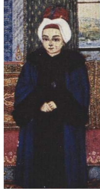
Şekil 24. Sultan III. Mustafa ve Oğlu Şehzade III. Selim, Ayrıntı Rafael İ.Ü. nr.9366 Kaynak: (Mahir, 2005: 248)