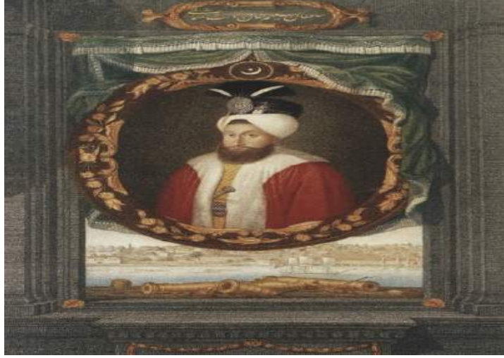
Şekil 12. Sultan III. Selim'in Yarım Boy Portresi, Kostantin Kapıdağlı, 1793, TSMK A.3689