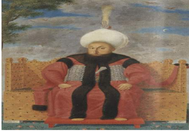
Şekil 9. Sultan III. Selim Bayram Tahtında, Kostantin Kapıdağlı'ya atfedilmektedir, 1789 TSMK A. 3109