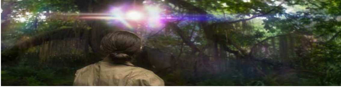
Annihilation, 00.30.20, Parıltı'nın içerisinde ışığın kırılması.

Parıltı'nın içi insanların bulunmadığı, doğanın hakimiyeti altında olan bir bölge olarak yansıtılmaktadır. Burada tercih edilen aydınlatma aracılığıyla Parıltı'nın içerisinde bulunan ekibin yalnızlığı ve bölgenin tekinsizliği efektif bir biçimde aktarılmaktadır. Gerek aydınlatma tercihleri gerekse görsel efektler ile aydınlatmanın desteklenmesi sonucu, bölgenin ıssızlığına dair bir atmosfer yaratılmaktadır. Örneğin Lena'nın ölmüş olan Sheppard'ı aradığı sahnede, Lena sık ağaçlıklarda yalnız başına dolaşmaktadır. Bu sahnede ağaçların arasından süzülen ışık kırılarak ortamın ıssızlığına işaret etmekte ve bunun sonucunda doğan tekinsizliğe bağlı gerginlik hissi yaratılmaktadır.