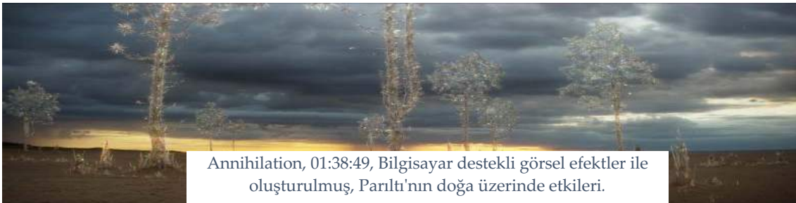
Annihilation, 01:38:49, Bilgisayar destekli görsel efektler ile oluşturulmuş, Parıltı'nın doğa üzerinde etkileri.

Bilgisayar destekli görsel efektlerle de izleyicide korku ve gerginlik duygusu yaratılmaktadır. Ekibin Southern Reach'e vardığında buldukları video kaydında, karnı yarılarak açılan askerin