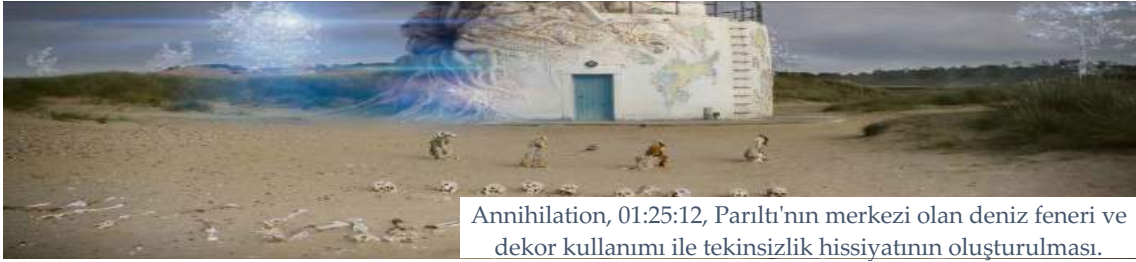
Annihilation, 01:25:12, Parıltı'nın merkezi olan deniz feneri ve dekor kullanımı ile tekinsizlik hissiyatının oluşturulması.

Parıltı içerisine gönderilmiş olan hiçbir şeyin geri dönmemiş olması izleyici üzerinde Parıltı'nın bilinmezliği ve tekinsizliği perspektifinden bir korku hissi oluşturmaktadır. Karakterler ile özdeşleşen izleyici, Parıltı içerisine giren karakterler hakkında bir yandan endişelenirken, bir yandan da olay örgüsünün gizem unsurundan ötürü olacaklara karşı merak duygusu beslemektedir. Böylece film anlatısının merkezinde bulunan Parıltı unsuru ile birlikte izleyicide anlaşılma ve bilinmezlik hissini, bu hisle bağlantılı olarak da korku hissini tetiklemeye çalışmaktadır. Ancak korku duygusu filmde fazla ön plana çıkamamakta, izleyici her ne kadar gerilim hissetse de gördükleri karşısında bir dehşet ve korku duymamaktadır. Tam aksine Parıltı'nın içerisi görsel olarak etkileyici tasarlanması, izleyicide merak ve hayranlık duygusu uyandırmakta, korkudan ziyade izleyici tekinsizlik ve ıssızlıktan kaynaklı olarak bir huzursuzluk hissettirmektedir.