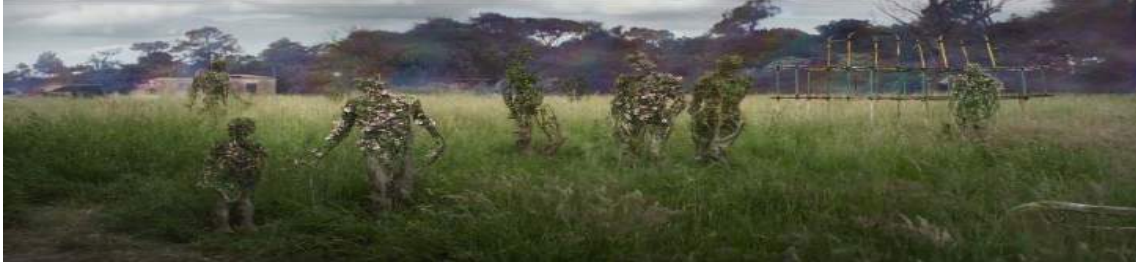
Annihilation, 01:04:13, Parıltı'nın doğa üzerinde yarattığı değişim.

Filmde Parıltı'nın kaynağı, canlı mı cansız mı olduğu, bir varlık mı yoksa bir fenomen mi olduğu bilinmemektedir. Film anlatısının temelini Parıltı'nın bilinmezliği üzerine kurarak, karakterler aracılığıyla izleyici üzerinde bir merak duygusu uyandırmakta ve bilinmeze karşı duyulan korku hissini harekete geçirmektedir. Parıltı'nın içerisine gönderilen canlı veya cansız hiçbir varlık geri dönmekte, Parıltı'nın içerisinden, dışarıdaki dünya ile iletişim kurulamamaktadır. Bu bağlamda Parıltı'nın ne olduğu tam bir muamma halindedir. Ayrıca Parıltı'nın sürekli bir genişleme eğilimi içerisinde olması, tedirginlik, korku ve dehşet yaratmaktadır. Böylece Parıltı ve Parıltı'nın kaynağının bilinemez, anlaşılmaz olması, Cosmic-Horror türü çerçevesinde