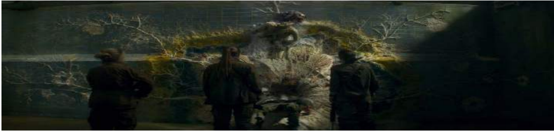
Annihilation, 00:48:02, Filmde dekor tasarımı.

Filmde gergin anlar müzik kullanımı ile desteklenmektedir. Özellikle filmin doruk noktasında kullanılan müzik, sahne ile oldukça uyumlu bir şekilde gerginlik ve bilinmezlik hissini artırarak, izleyici üzerinde etki yaratmaktadır. Burada Dr. Ventress'in fener içerisinde yok oluşu sonrasında ortaya çıkan Parıltı'nın kaynağı ile birlikte sahneye cızırtıların ön planda olduğu ve bas tonların ağırlıklı kullanıldığı elektronik müzik hakimdir. Böylelikle sahnede kullanılan müziğin temposu yavaş, ancak şiddeti yüksektir. Müziğin filmsel anlatının yavaş akan temposu ile uyumlu olması, genel olarak gerginliği ve aksiyonu destekleyici niteliktedir.