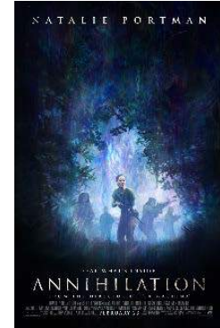
Annihilation Film Afşi